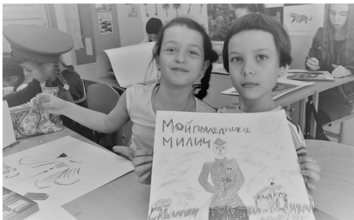
Рис 4. Учащиеся ГБОУ «Гимназия № 92 Выборгского района» принимают участие в Акции (Санкт-Петербург)