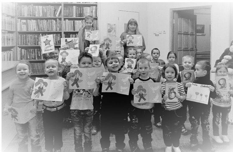
Рис 7. Читатели Центральной городской библиотеки имени В.В. Маяковского с созданными в рамках Акции творческими работами (Чувашская Республика, г. Чебоксары)