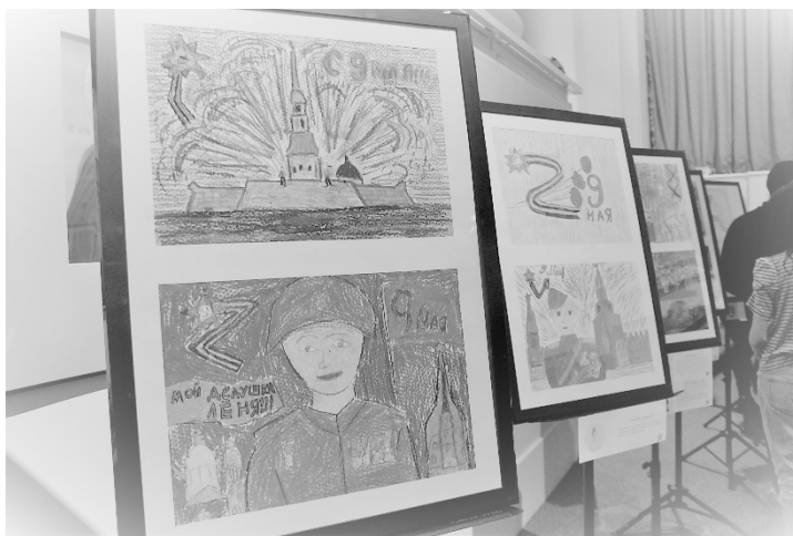
Рис 5. Выставка лучших работ учащихся школ Выборгского района Санкт-Петербурга – участников Акции (Санкт-Петербург)