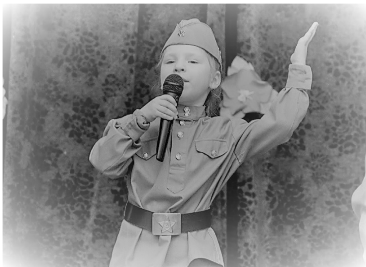
Рис 2. Старт Акции на базе дошкольного отделения ГБОУ «Школа № 1359 имени авиаконструктора М.Л. Миля» (Москва)