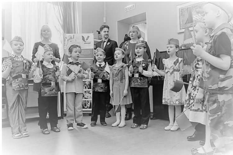
Рис 3. Подведение итогов Акции на базе дошкольного отделения ГБОУ «Школа № 2101» (Москва)