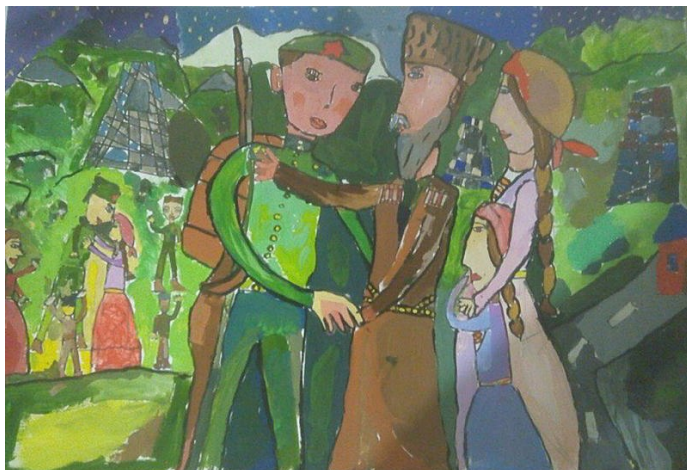
Цокова Кира, 6 лет «Возвращение домой» Республиканский Лицей Искусств (г.Владикавказ)