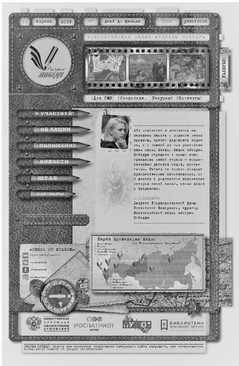
Рис 1. Внешний вид сайта Всероссийской акции «Рисуем Победу»