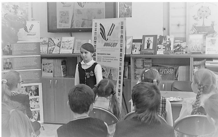
Рис 6. Проведение Акции в Библиоцентре детского чтения Выборгского района Санкт-Петербурга (Санкт-Петербург)